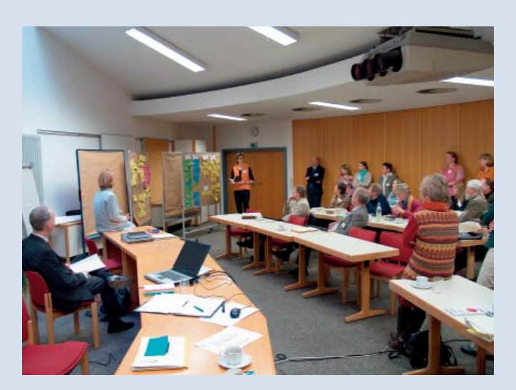
Netzwerk-Workshop zum Thema "Lust auf Zukunft – Nachhaltigkeit und Kommunikation" am 21. März 2007 in Stuttgart

Er soll partizipativ und arbeitsfähig, visionär und realistisch, flexibel und zielführend, effizient und effektiv und letztlich auf Inhalte und den Prozess bezogen nachhaltig sein.