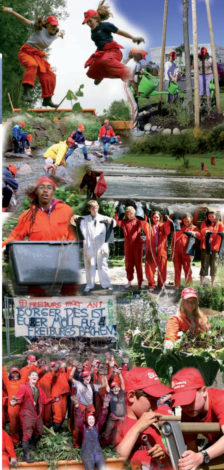
Otto Neideck, Erster Bürgermeister Freiburg, im April 2008

Ich würde mich freuen, wenn Sie, liebe Bürgerinnen und Bürger, die mit großem Engagement und Sorgfalt vorbereitete Aktion Freiburg packt an auch in diesem Jahr wieder tatkräftig unterstützen würden. Dafür gilt Ihnen heute schon mein herzliches Dankeschön!